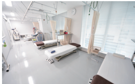
先進的な診断・治療を可能にする充実した院内設備。ペイン治療室6床

ニックで治療するなど診断後の選択肢が増えることは、手術をしたくない患者さんにとってとても良いこと」とそのメリットを語る。