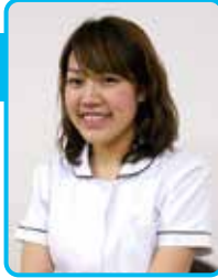
新札幌恵愛会病院 保健師

“メタボ”の正式名称はメタボリックシンドローム(内臓脂肪症候群)で、高血圧、高血糖、高脂質のうち2つ以上ある状態を言います(表)。