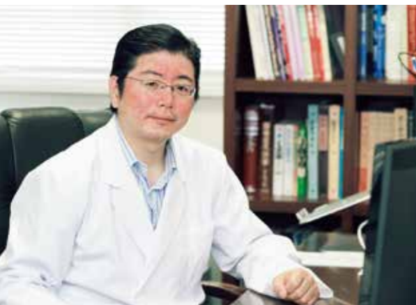
禎心会病院副院長・ 脳卒中センターセンター長

脳神経外科医に必要なだと私が思う資質は、「ハート」です。ちよつと手先が器用だとか、頭が良いということは実は余り関係ありません。本当に患者さま思いであること、そして人を相手にしていることを忘れずに優しくできる人間が、良い脳神経外科医となり得ます。