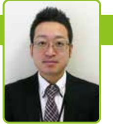
禎心会病院 地域連携室 係長

病気やけがは突然やってきます。患者さまが安心して治療を受けられるよう、知っておきたい病院の種類や機能についてご説明します。