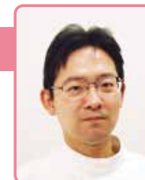
セントラル 女性クリニック 院長