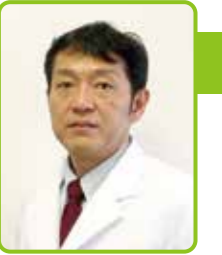
禎心会病院 脊椎・脊髄末梢神経センター長

高齢化社会を迎え、しびれ、痛みでお悩みの方は年々増加しています。当センターはそのような方々を専門に診ています。