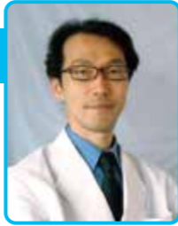
新札幌恵愛会病院 内科

本態性振戦は症状がふるえのみの病気。逆にいうと、ふるえ以外みられないのが特徴で40歳以上の16人に1人が患っているといわれ、家族や親類にもいる家族性振戦もあります。