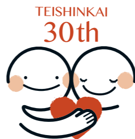
30周年記念ロゴマーク

社会医療法人禎心会は30周年を迎え、「法人スローガン」と「30周年記念ロゴ」を作成いたしました。