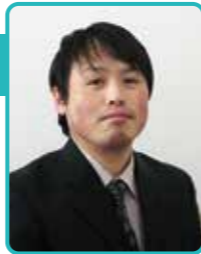
稚内市南地区 居宅介護支援事業所 介護支援専門員

知人に友人、近所の人からや、新聞、テレビといった各媒体でも見たり耳にしたりする「ケアマネジャー」。一体、何をしているかご存知ですか？