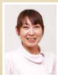
新札幌恵愛会病院 栄養科 管理栄養士