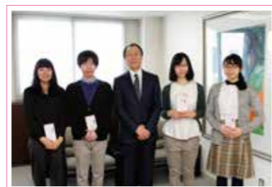
優秀賞・佳作受賞者と徳田理事長