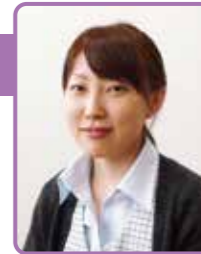
稚内 稚心会病院 医事課

「診療報酬」は医療機関の診療行為に対し、医療保険から支払われる報酬のことです。その診療点数(1点10円)は国が決め、今年度は2年毎の改定年度です。