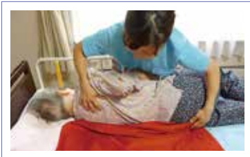
①体を横に起こし、シートを敷く