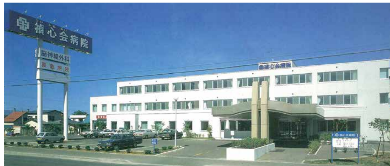
開院時建物(昭和59年)