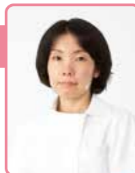
さっぽろ北口クリニック 乳腺外科