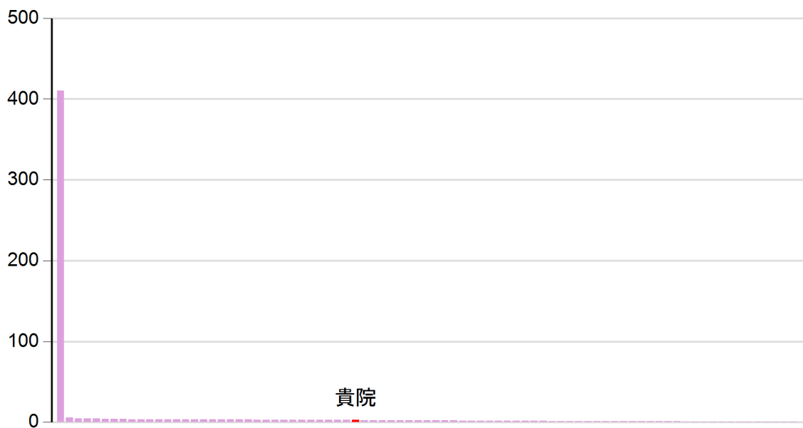
手術室1室あたり1日あたり手術室総稼働時間